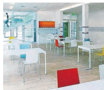
Besonders hell und freundlich wurden die Räumlichkeiten der Tageswerkstätte der Lebenshilfe Weiz gestaltet.

Vor allem der Platzmangel veranlasst die Verantwortlichen der Lebenshilfe Weiz dazu, einen neuen „Lebensraum“ bzw. Arbeitsbereich für ihre Kunden und Kundinnen