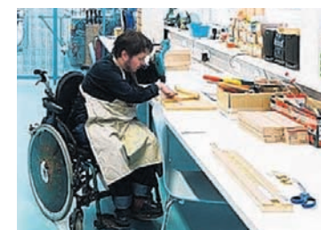
Jetzt gibt es genügend Platz um der Kreativität freien Lauf zu lassen.

Lieb Bau Weiz: Das Unternehmen zeichnete sich für die Baumeister, Trockenbau, Zimmermeisterarbeiten, Kunststofffenster und Außenjalousien verantwortlich.